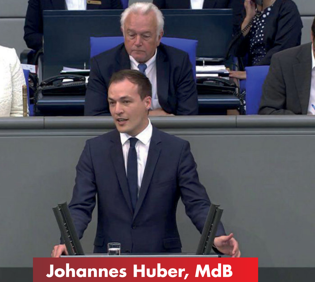
Johannes Huber, MdB

Wahlkreis 214: Freising, Pfaffenhofen, Schrobenhausen